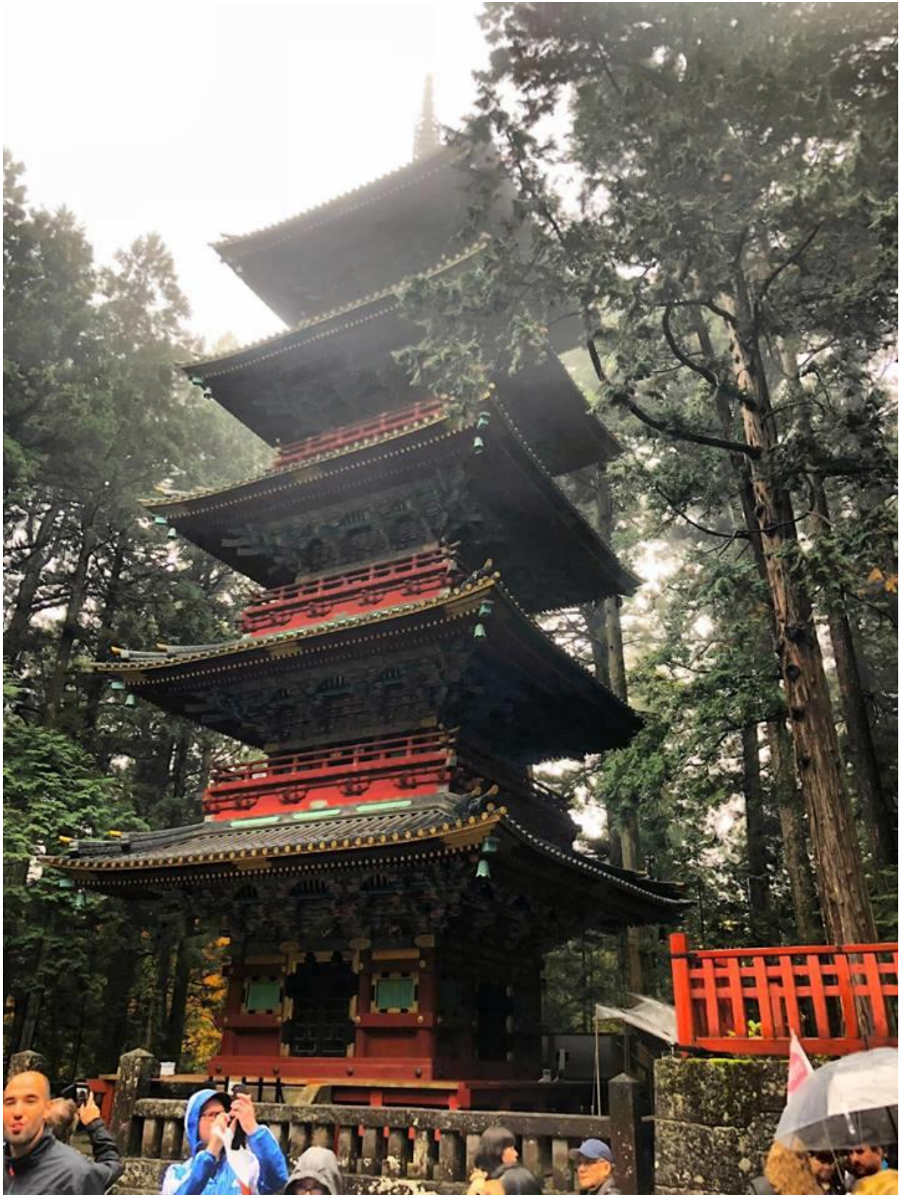
Ma az egyetlen nap amikor az időjárás nem volt tökéletes, de tökéletesen megfelel a helyszínhez.